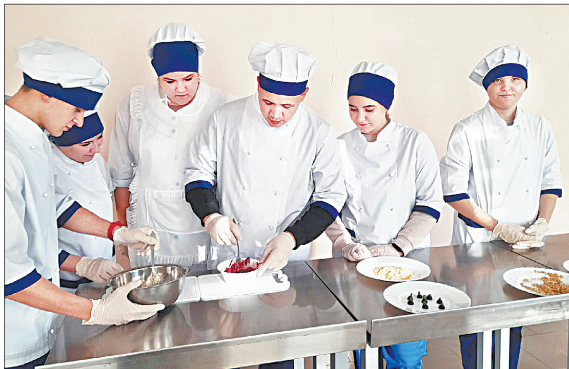
Студенты Ровенского политехнического техникума принимали активное участие в мастер-классах по приготовлению праздничных блюд

Пищей для ума студентам послужили мероприятия «Чудеса накануне Рождества» и «Великий год России». Ребята соотносили цитаты и имена их авторов, решали тематические военно-исторические познавательные задачи, знакомились с неизвестными страницами истории и традиций Рождества Христова.