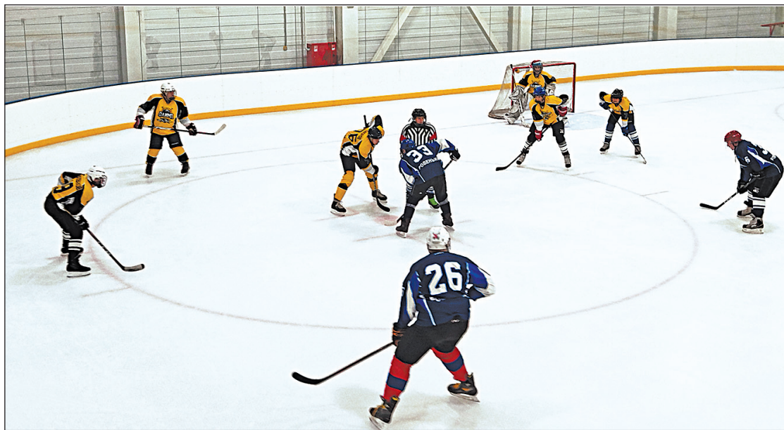
Команды «Ровеньки» и «Олимп» сражаются на ледовой арене

Накал страстей возрос во втором и третьем периодах. Были такие моменты,