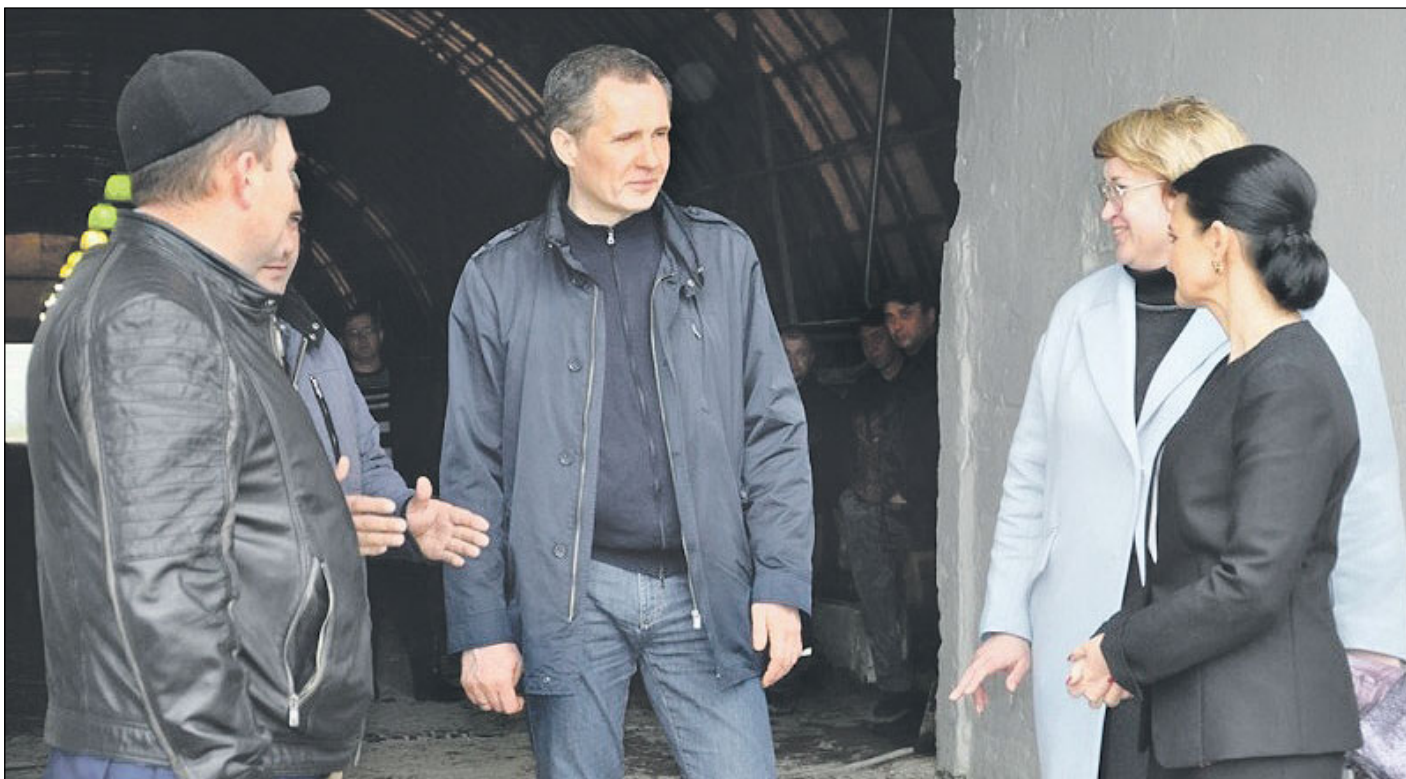
Встреча губернатора с ровенчанами во время его приезда в район

18 ноября исполнилось два года, когда Указом Президента России В.В. Путиным, руководителем Белгородской области был назначен Вячеслав Владимирович Gladkov. Возглавил регион в очень непростое время. Сначала COVID-19, в связи с чем надо было принимать экстренные меры по организации оказания медицинской помощи населению, и с ним успешно справились. Сейчас – специальная военная операция. В приграничной области, какой является наша Белгородчина, приходится решать много проблем, связанных с безопасностью населения. Не остаются без внимания мобилизованные для прохождения службы в специальной военной операции белгородцы и их семьи.